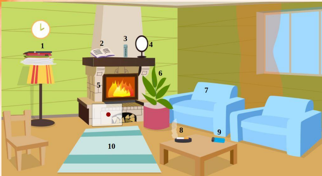
Рис. 4 Проверь найденные нарушения пожарной безопасности в гостиной