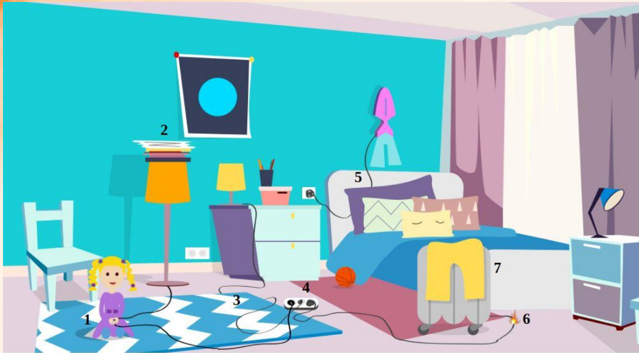
Рис. 5 Проверь найденные нарушения пожарной безопасности в детской