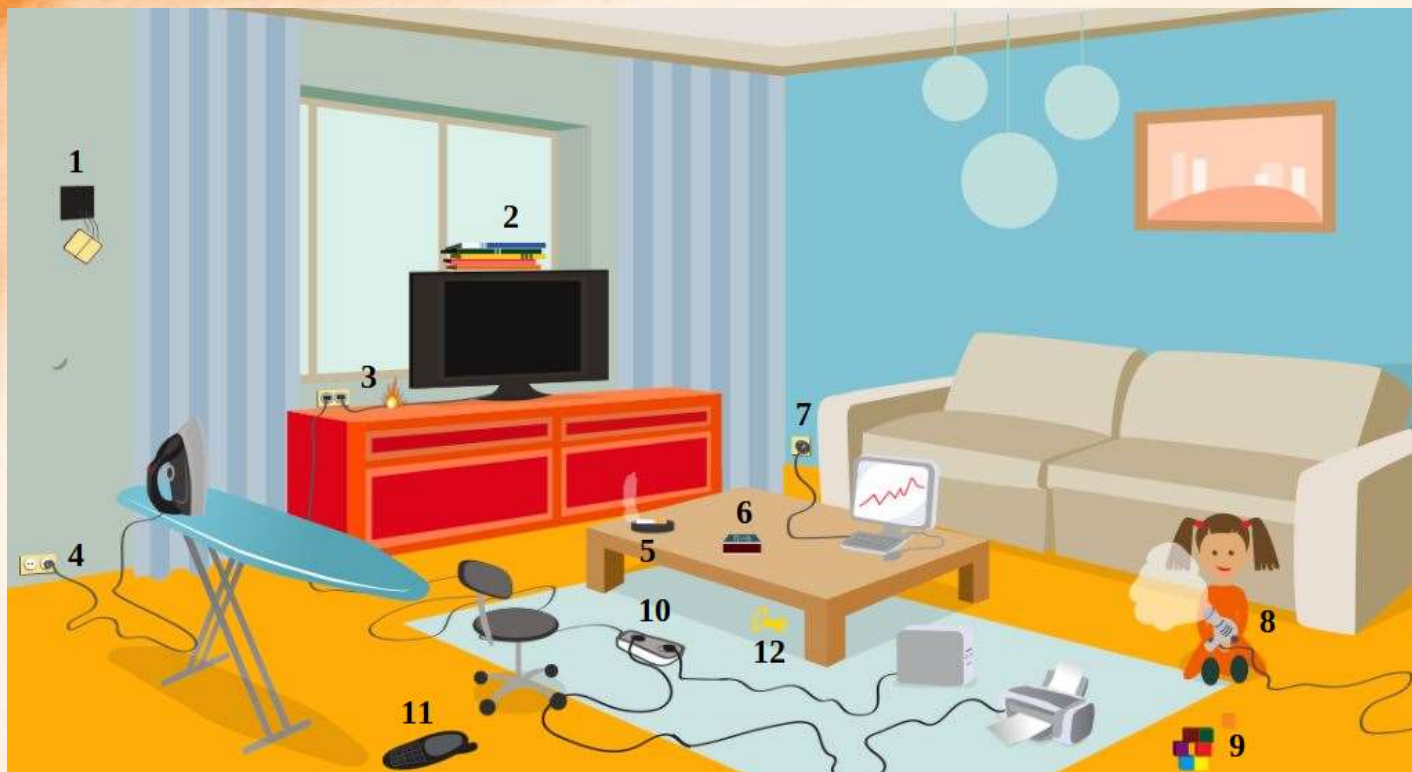
Рис. 3 Проверь найденные нарушения пожарной безопасности в гостиной