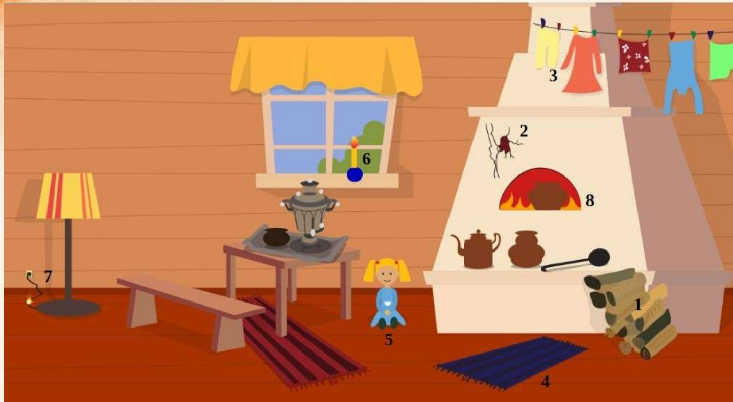
Рис. 1 Проверь найденные нарушения пожарной безопасности в доме