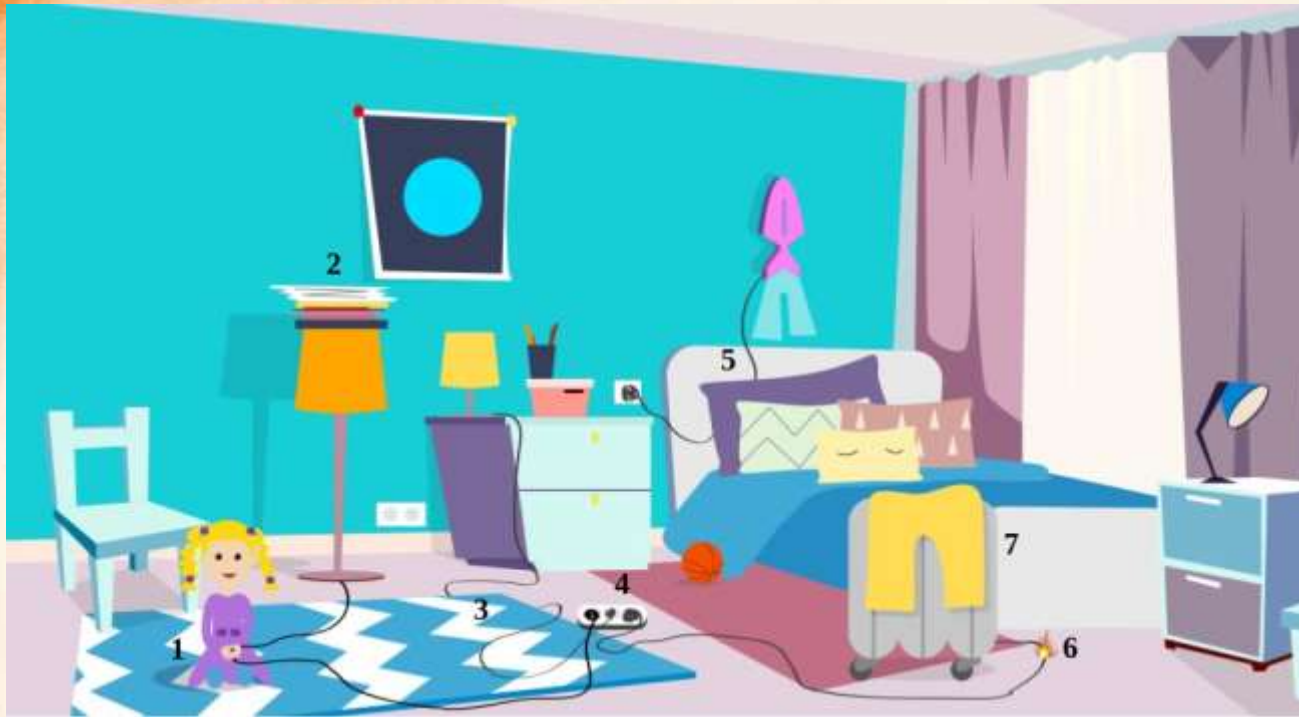
Рис. 5 Проверь найденные нарушения пожарной безопасности в детской