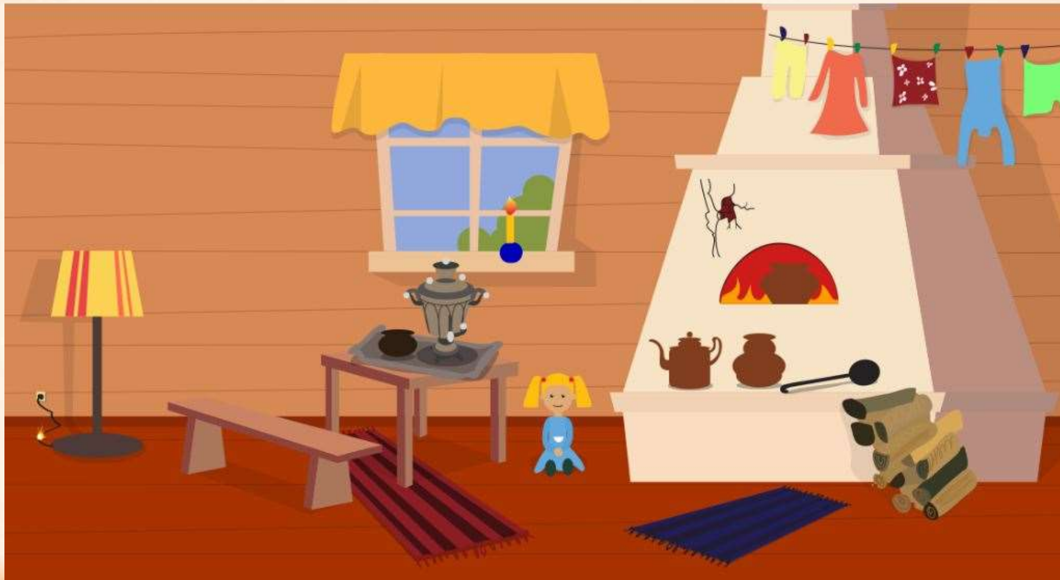
Рис. 1 Найди нарушения пожарной безопасности в доме (8 нарушений)