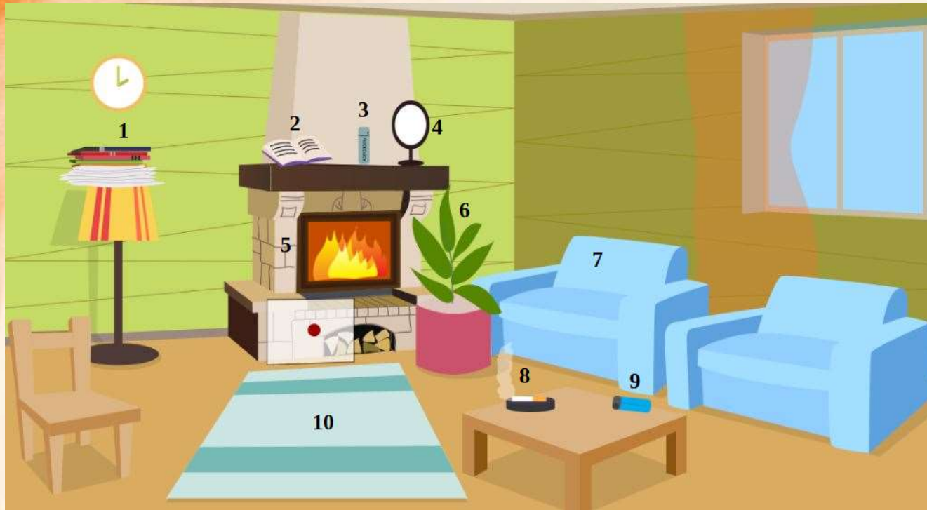
Рис. 4 Проверь найденные нарушения пожарной безопасности в гостиной